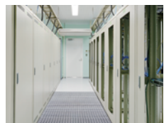
冷えた外気が吹き出す コールドアイル側