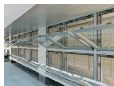
暖かい空気を排出する 排気窓