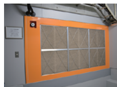
AHU (写真左: 前面 右: 背面)

外気を取り込みます。フィルターにて不純物を除去後、内部の地下水コイルにて外気を冷やします。また、必要に応じて加湿を行い、適度な気温・湿度にて、ファンによりサーバー室に空気を送り込みます。